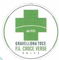
P. A. Croce Verde di Gravellona Toce