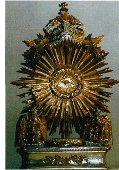
Patrimonio dell'Oratorio di San Giuseppe: tronetto ligneo, fine XVIII secolo