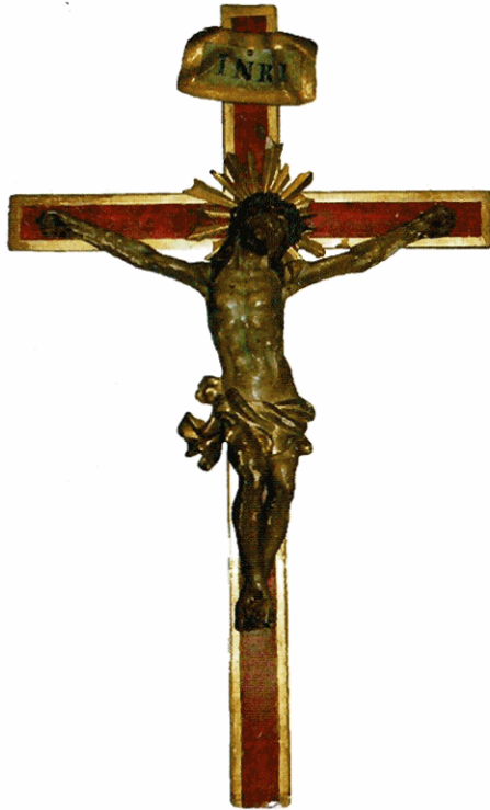
Oratorio di San Giuseppe: crocifisso ligneo policromo, ultimo quarto XVIII secolo

visibile in alcune solennità. L'opera, di scuola piemontese, fu realizzata su commissione. È possibile ipotizzare tra i committenti sia la famiglia Pattoni, sia gli stessi abitanti di Pedemonte. È quasi certo che il modello preso per la sua realizzazione sia quel crocifisso, posto all'altare della Madonna del Rosario, custodito nella chiesa di San Tommaso a Montebuglio, dove don Capra era parroco. In questo periodo entrò in San Giuseppe anche un tronetto ligneo, oggi conservato tra i tesori della parrocchia di Gravelona Toce, ma appartenente al patrimonio dotale dell'oratorio di Pedemonte.