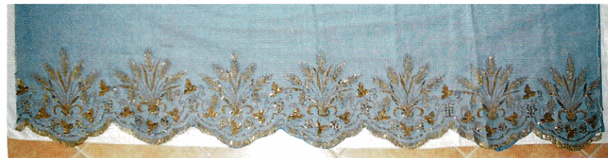
Oratorio di San Giuseppe: tovaglia a spighe d'oro, fine sec. XIX