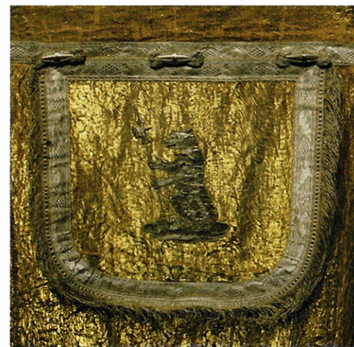
Oratorio di San Giuseppe: piviale in oro e argento, fine XIX sec., particolare raffigurante lo stemma dei Camona Tarroz