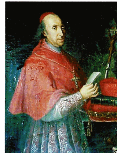
Giuseppe Morozzo Della Rocca, cardinale e vescovo di Novara dal primo ottobre 1817 al 22 marzo 1842