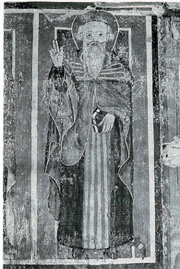
Affresco raffigurante un santo.