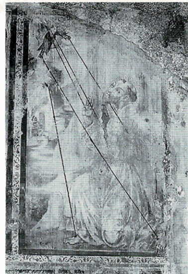
S. Francesco riceve le stimmate

nella basilica edificata appositamente a S. Maurizio. A Roma, nell'antica basilica di S. Pietro, vi era un altare di S. Maurizio, al quale i sovrani germanici erano soliti ricevere la corona imperiale.