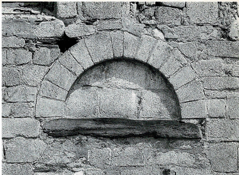
Chiesa di S. Maurizio: particolare di un arco sul fianco sinistro.