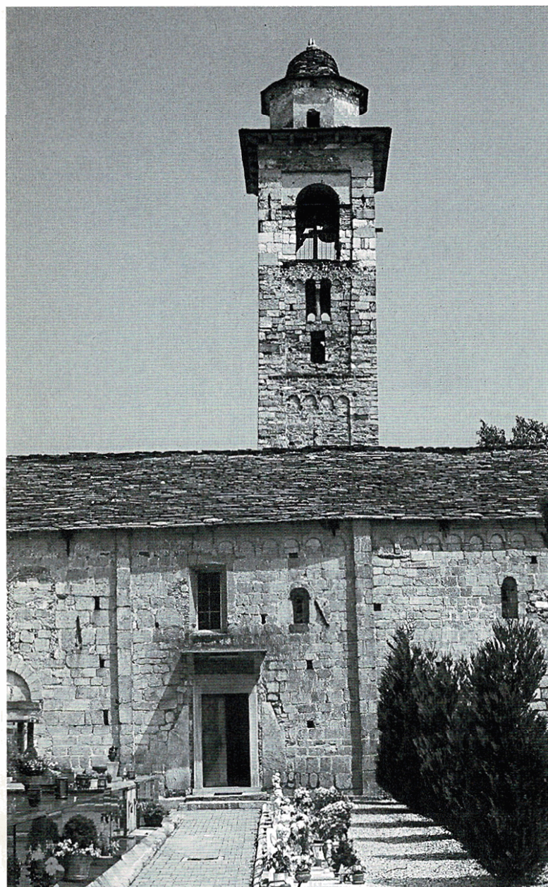
Veduta del fianco sinistro, dal camposanto.

Due quadroni mostrano S. Maurizio a cavallo: nel primo, più antico, il santo è ri-