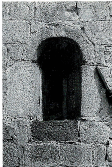
Una finestrella sul fianco sinistro.

La chiesa di S. Maurizio si trova a nord dell'odierno centro cittadino, lungo la strada statale del Sempione, inglobata nel recinto del camposanto. E' il più antico e rilevante monumento gravellonese. Parecchi reperti archeologici, emersi negli scavi effettuati nel 1957, attestano che l'area dove sorge fu abitata fin dai tempi dell'invasione gallo-celtica (V sec. aC).