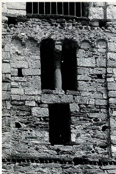
Una bifora del campanile.