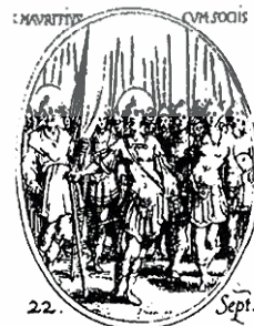
S. Maurizio ed i commilitoni martiri.

È considerato il patrono dei tintori perché descritto come un moro (dove anche il nome); ed i mori erano popolarmente ritenuti bianchi con la pelle tinta.